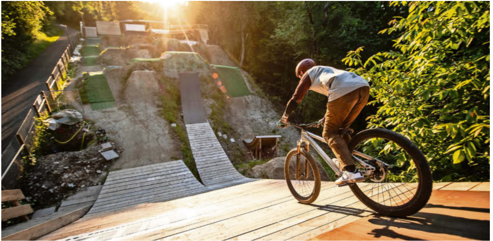
Mittels eines Crowdfunding haben die Betreiber Geld gesammelt und eineinhalb Jahre lang den Bikepark umgestaltet.